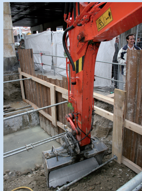
Le CEVA démarre.

Le projet coûte 950 millions de francs suisses. 400 millions sont investis par le Canton de Genève, et 550 millions sont à la charge de la Confédération et des CFF. La part cantonale du financement (400 millions) a été voté le 26 juin 2002 par le Grand Conseil. Il subsiste quelques points à régler quant aux sources de financement de la part fédérale, mais le suspense n'est que relatif et les décisions tomberont prochainement.